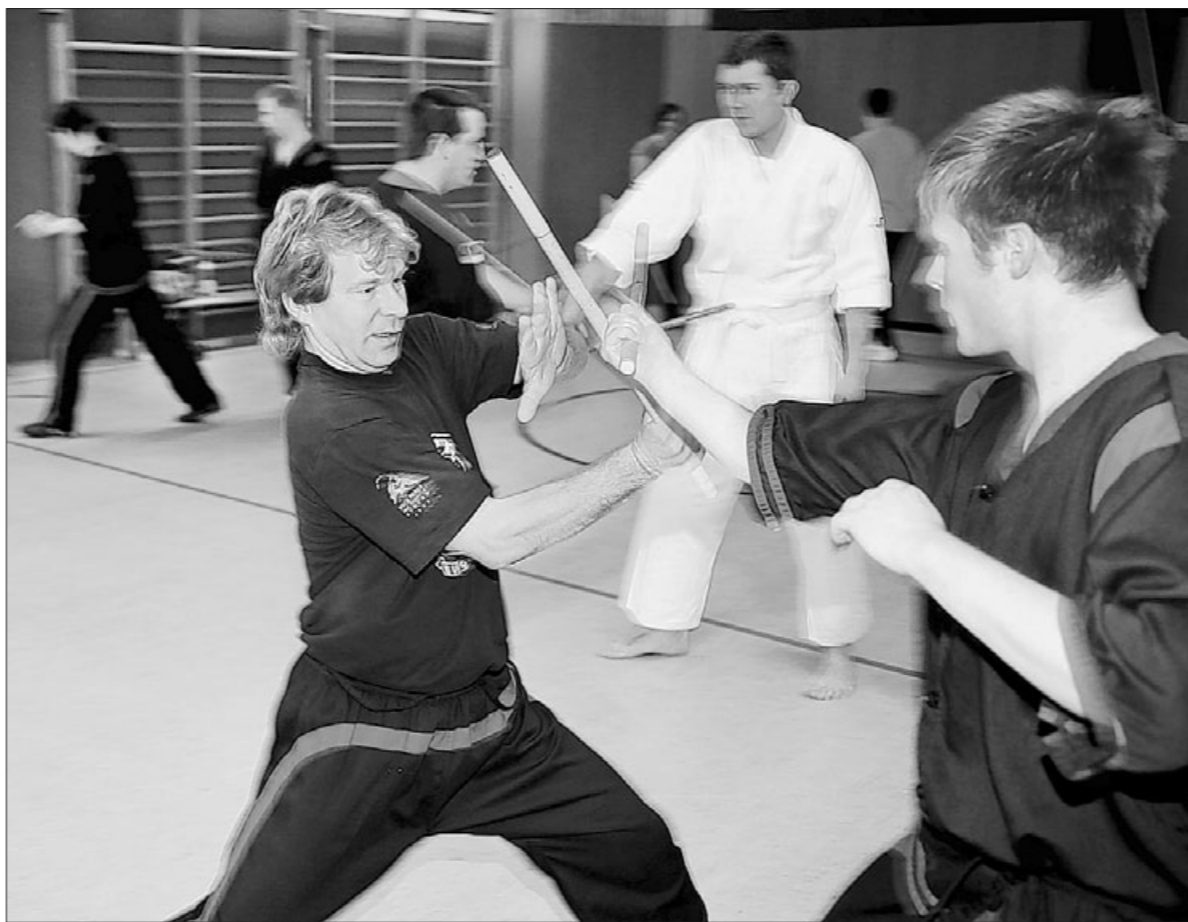
Eskrima-Lehrgang in Geislingen. Anspruchsvolle Schlagmuster und schnelle Bewegungen.